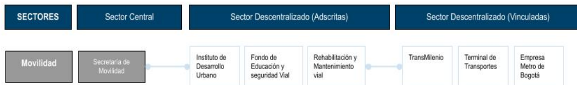
Figura 1. Esquema preliminar del marco institucional

La Figura 1 muestra un esquema preliminar del marco institucional creado para la ejecución de la Extensión de la L2MB. de acuerdo a las competencias establecidas de las entidades gubernamentales a lo largo del proyecto.