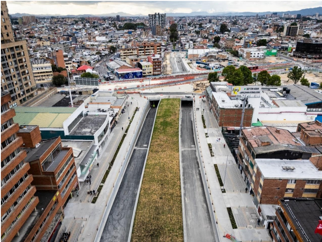
Vista panorámica del intercambiador vial de la calle 72.